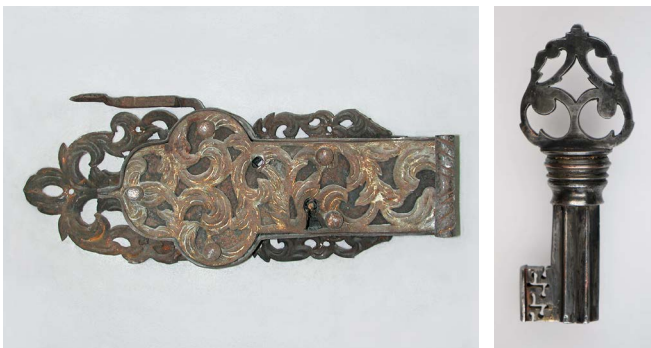
Links: Dom Freising, Maximilians Kapelle, 18. Jh.; Rechts: Kopie eines Renaissanceschlüssels; Vorderseite: Schatullen-Chubbbschloss mit Wächter, England, 2. Hälfte 19. Jh.; Abb. Karte: Türschloss aus der Bauteilesammlung im Kloster Thierhaupten

Seminarleitung: Dipl.-Ing. (FH) Eberhard Ludwig, Restaurator im Handwerk