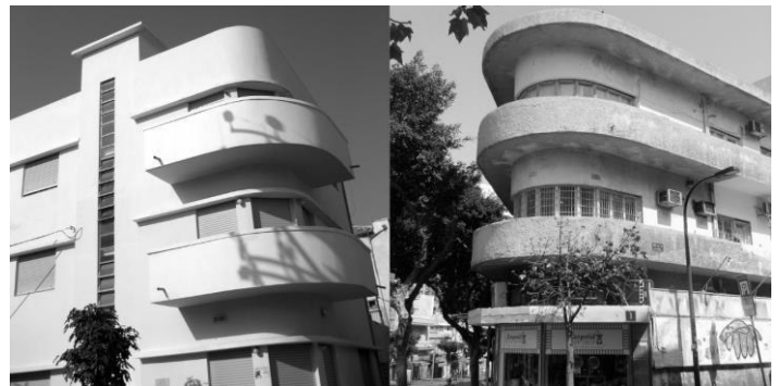
Bauhausgebäude in Tel Aviv

Im Februar 2014 war im Deutschen Architektenblatt zu lesen, dass ein Appell zur Rettung von Bauten der Frühmoderne in Tel Aviv an Architekten in Deutschland gerichtet wurde. Die israelische Metropole verfügt über die größte Konzentration von Bauten aus den 1930er Jahren. Noch etwa 4.000 Häuser sind erhalten, von denen die Hälfte unter Denkmalschutz steht. Viele wurden von emigrierten deutschen Architekten errichtet. Ein Großteil der „Weißen Stadt“ ist jedoch in schlechtem Zustand und muss saniert oder grundlegend instand gesetzt werden. Erst in den 90er-Jahren begann die Stadtverwaltung, Häuser unter Denkmalschutz zu stellen. Doch für die Restaurierung fehlt im Land oft das Knowhow. Diese Ausgangssituation bietet enormes Potential für deutsche Architekten, Restauratoren und Fachhandwerker.